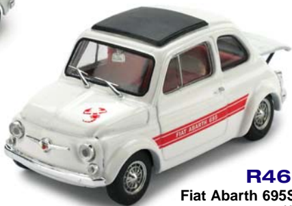
R463 Fiat Abarth 695SS assetto corsa 1968