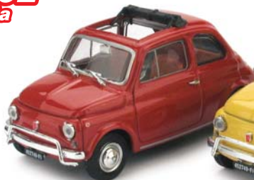
R464-02 Fiat 500L 1965-1972 Lusso aperta 12 colorazioni disponibili