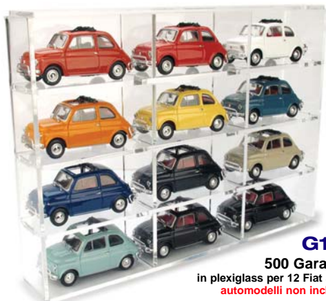
G12 500 Garage in plexiglass per 12 Fiat 500 automodelli non inclusi

riproduzione del motore molto particolareggiata!