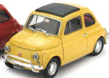
R465-05 Fiat 500L 1965-1972 Lusso chiusa 12 colorazioni disponibili