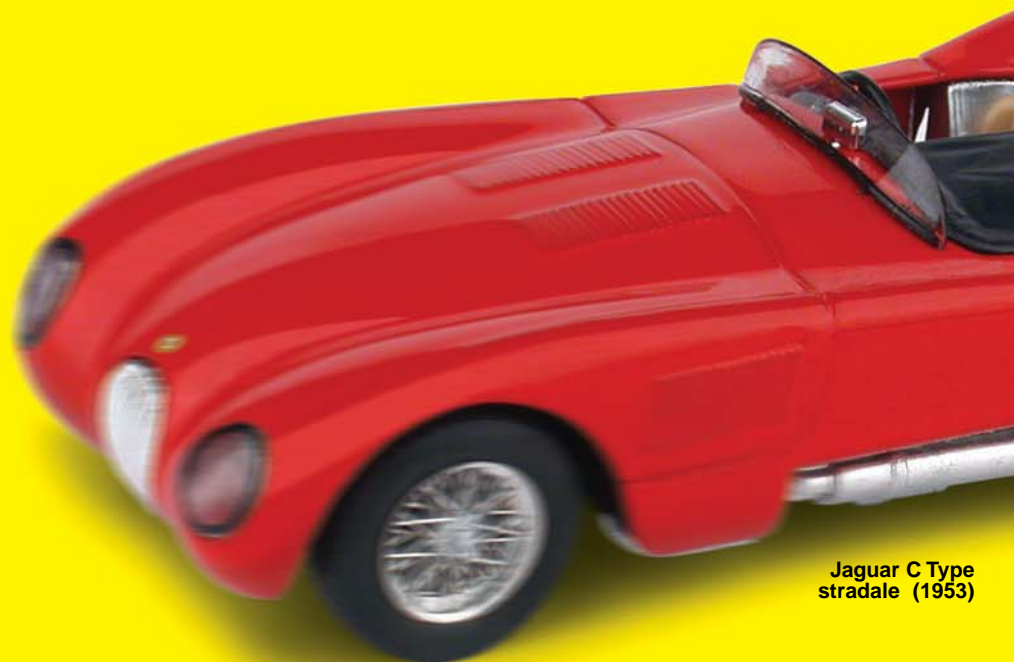
Jaguar C Type stradale (1953)