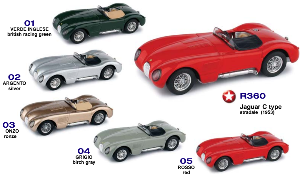
01 VERDE INGLESE british racing green