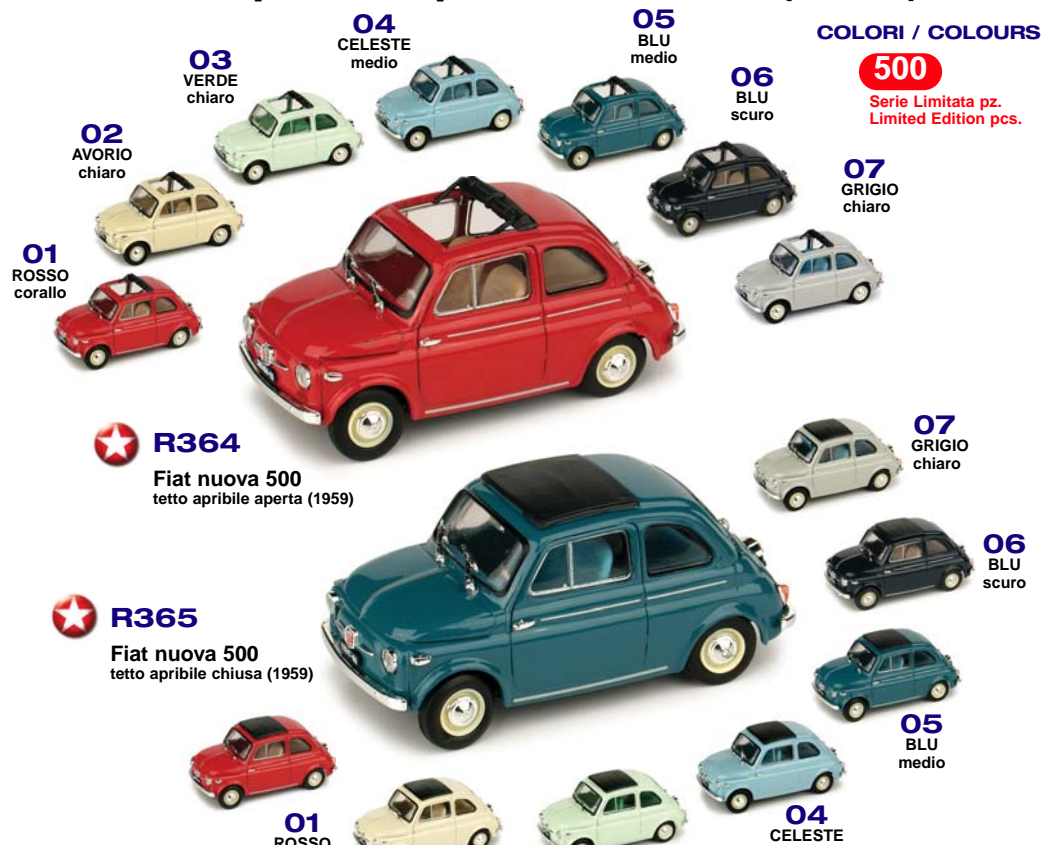
02 AVORIO chiaro