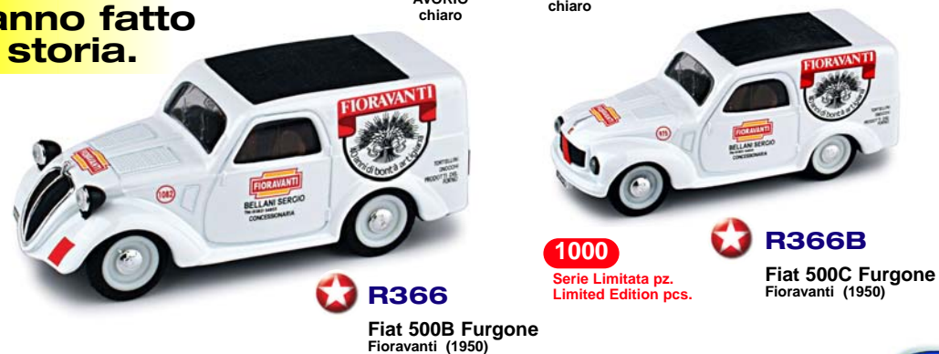
R366 Fiat 500B Furgone Fioravanti (1950)

1000 Serie Limitata pz. Limited Edition pcs.