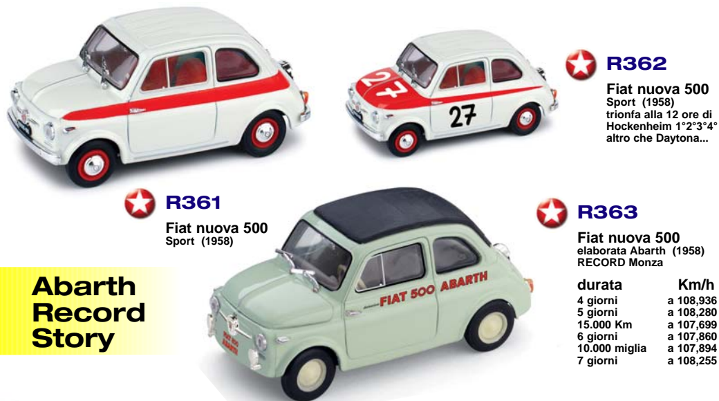
R361 Fiat nuova 500 Sport (1958)