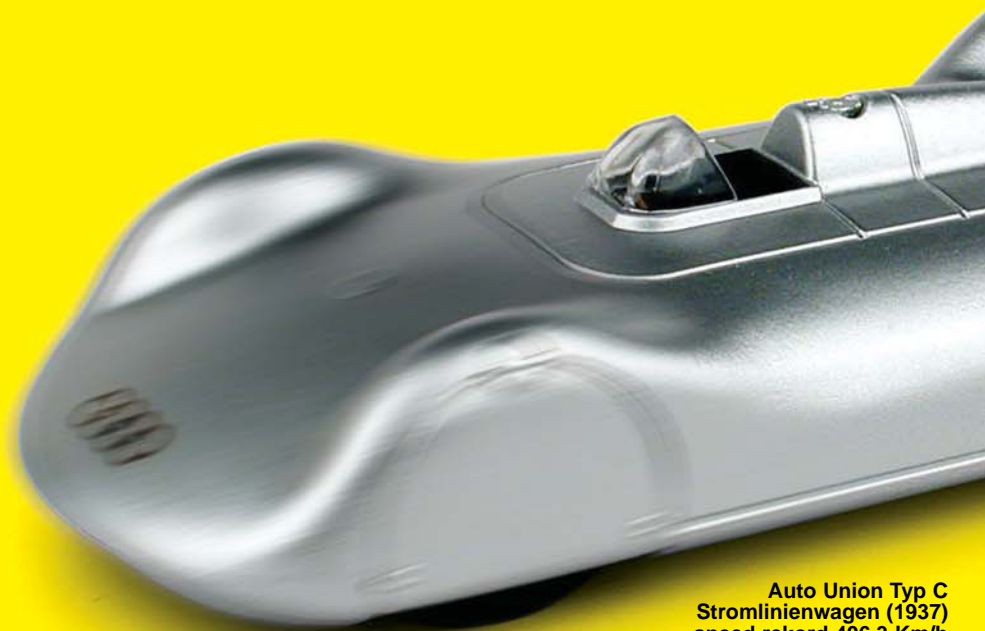
Auto Union Typ C Stromlinienwagen (1937) speed rekord 406,3 Km/h