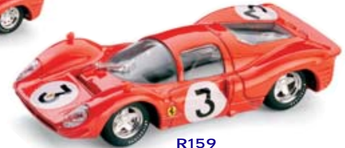
R159 Ferrari 330P4 1000Km Monza (1967) 1° Bandini - Amon