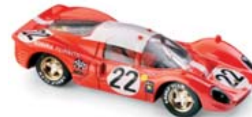
R161 Ferrari 412P Le Mans (1967) Guichet - Mueller Scuderia Filipinetti