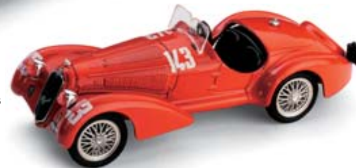
R141 Alfa Romeo 8C 2900B Mille Miglia (1938)