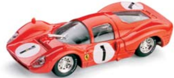
R157 Ferrari 330P3 1000Km Spa (1966) 1° Parker's - Scarfiotti