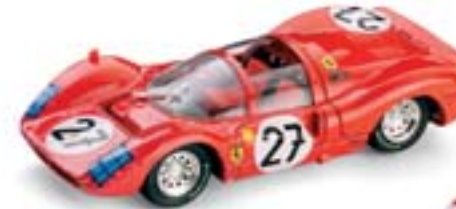
R158 Ferrari 330P3 Spyder Le Mans (1966) Rodriguez - Ginther Scuderia N.A.R.T.