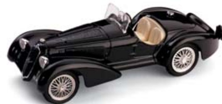
R139 Alfa Romeo 8C 2900B (1938) nero