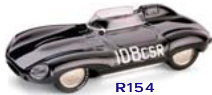
R154 Jaguar D type Record Bonville USA (1960) Tom Ruthford