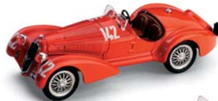
R140 Alfa Romeo 8C 2900B Rally ColliTorinesi (1938)