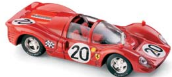
R160 Ferrari 330P4 Spyder Le Mans (1967) Amon - Vaccarella