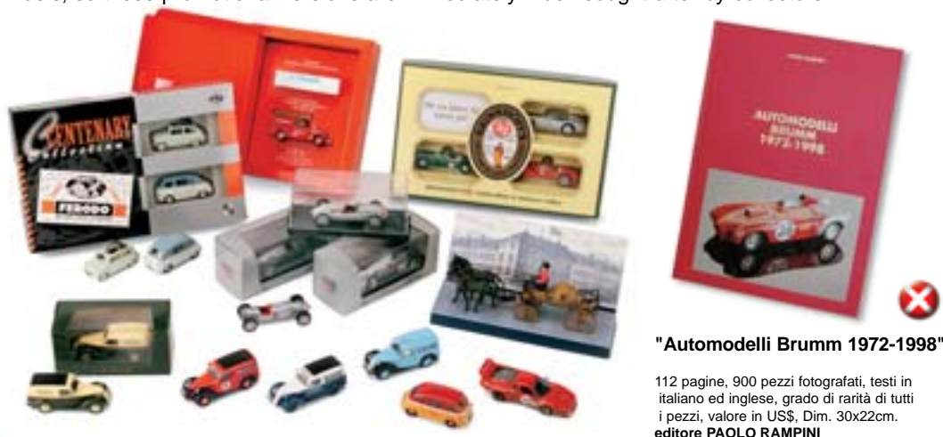
"Automodelli Brumm 1972-1998"