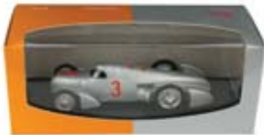
Audi Tradition collection (D-worldwide) www.audi.com

Presenti nel catalogo della linea accessori "Audi collection" sin dal 1997 con 4 automodelli di Auto Union, questi automodelli sono in vendita con il nuovo packaging 2002 esclusivamente nelle boutique Audi. Included in the catalogue "Audi Collection" accessory line since 1997, the 4 Auto Union model cars are sold in the new 2002 packaging only in the Audi boutiques.