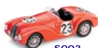
S003 Ferrari 815 Circuito di Pescara