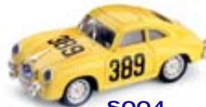
S004 Porsche 356 Rally delle Alpi