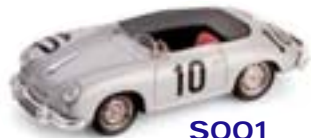
S001 Porsche 356 Avus