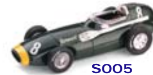
S005 Vanwall F.1 GP Marocco (1958) 1° Stirling Moss