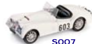
S007 Jaguar XK120 Rally delle Alpi (1948)