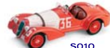
S010 Alfa Romeo 8C 2900B G.P. Bremgarten (1948)