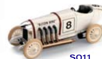
S011 Benz Blitzen Berlino-Avus (1911)