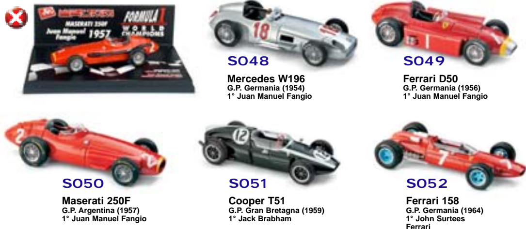
S048 Mercedes W196 G.P. Germania (1954) 1° Juan Manuel Fangio

I piloti che si sono fregiati del titolo di Campioni del Mondo di Formula 1 (2a parte di ...); altri cinque modelli dedicati a Juan Manuel Fangio, Jack Brabham e John Surtees nel nuovissimo package "plus". The 2nd part of the serried dedicated to F1 World Champion drivers; five models in the new "plus" packaging dedicated to Juan Manuel Fangio, Jack Brabham and John Surtees.