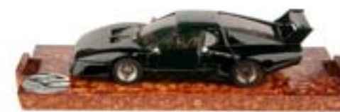
N.B Basetta in simil radica