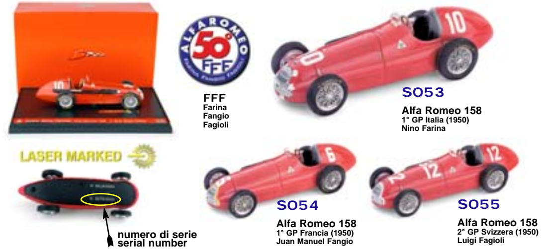
50 FFF FFF Farina Fangio Fagioli

Prodotta in occasione del 50° anniversario del doppio titolo mondiale di Formula 1 1950-1951 e dedicata alle famose 3 F di Farina, Fangio e Fagioli, che dominavano con le mitiche Alfette 158. Produced to commemorate the 50° anniversary of the double F.1 World Championship of 1950-1951 and dedicated to the famous "3 Fs" (Farina, Fangio and Fagioli) who raced the immortal "Alfetta" 158.