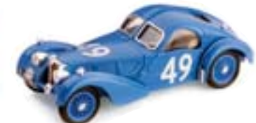
S012 Bugatti 57S "Atlantic" Tourist Trophy (1935)