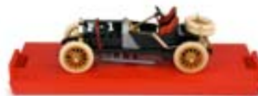
N.B Basetta rossa ( solo S002 )