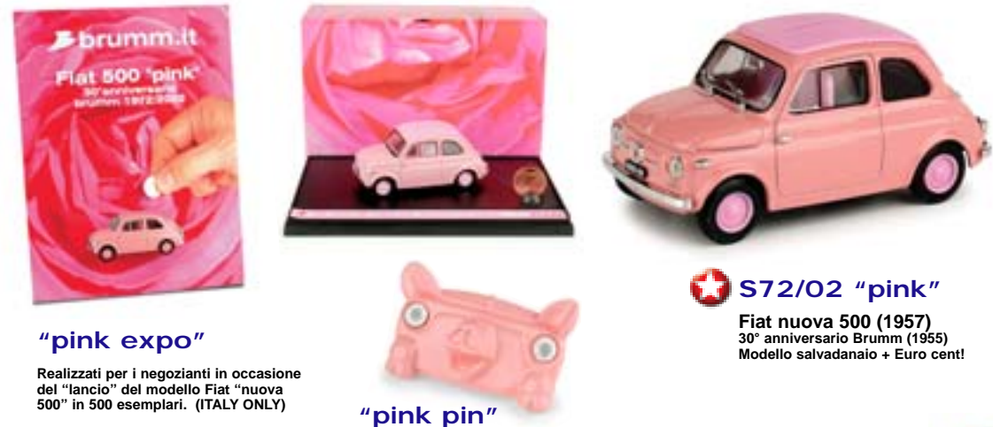
brumm.it Fiat 500 'pink' 30° anniversario Brumm 1972-2002

Ricordate il primo cent di Paperon de' Paperoni? Anche Brumm, in occasione del suo trentesimo anniversario, vuole offrire ai collezionisti un simpatico portafortuna, simbolo di prosperità, simpatia e sempre rispettoso del rapporto qualità-prezzo. Ecco allora la "500 Pinkg", un modello-salvadanaio per sorridere insieme. Do you remember Uncle Scrooge's first cent in the Walt Disney cartoon of the sixties? On its thirtieth anniversary, Brumm wants to offer a similar good luck charm (at the best quality/price ratio) to wish prosperity and good luck to model car collectors. The "500 Pink", is a moneybox model car created to have a smile all together.