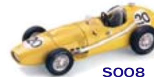
S008 Ferrari D246 GP Belgio (1958) Olivier Gendebien Scuderia Francorchamps