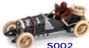
S002 Fiat F2 Corsa